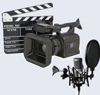
audycje telewizyjne i radiowe