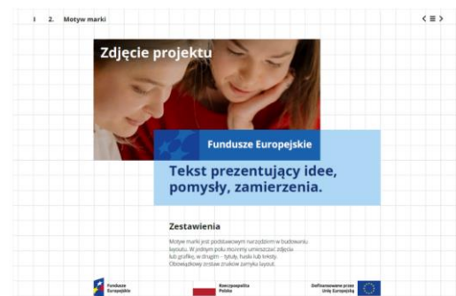
KTW Marki FE 2021-2027